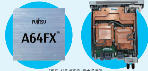
「富岳」試作機画像：富士通提供