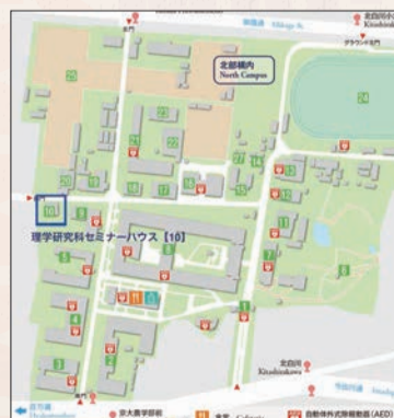
会場案内図 理学研究科セミナーハウス